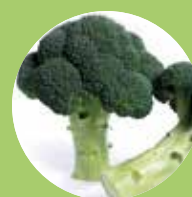
Brokkoli fajtáink és újdonságok