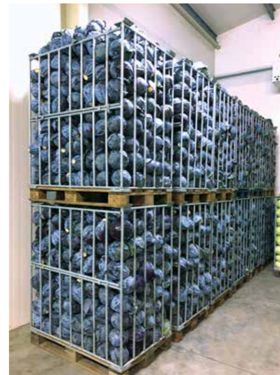
Káposztafélék | Fajtaajánlat | 2020