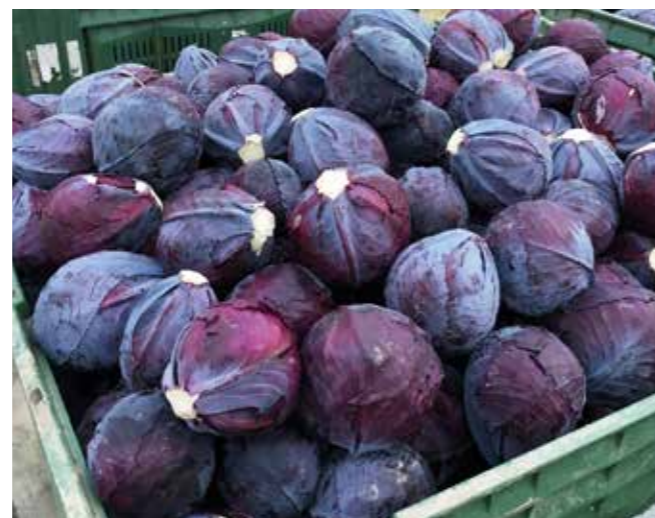
Rijk Zwaan | Sharing a healthy future