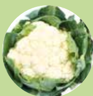
Karfiol fajtáink – zöld karfiol és romanesco