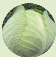
Fejes-, kel, vöröskáposzta fajták és újdonságok