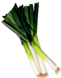
Floccus RZ (38-LE005)