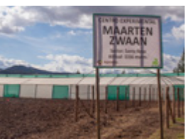
Maarten Zwaan Trainingscentrum in de buurt van de stad Cuzco