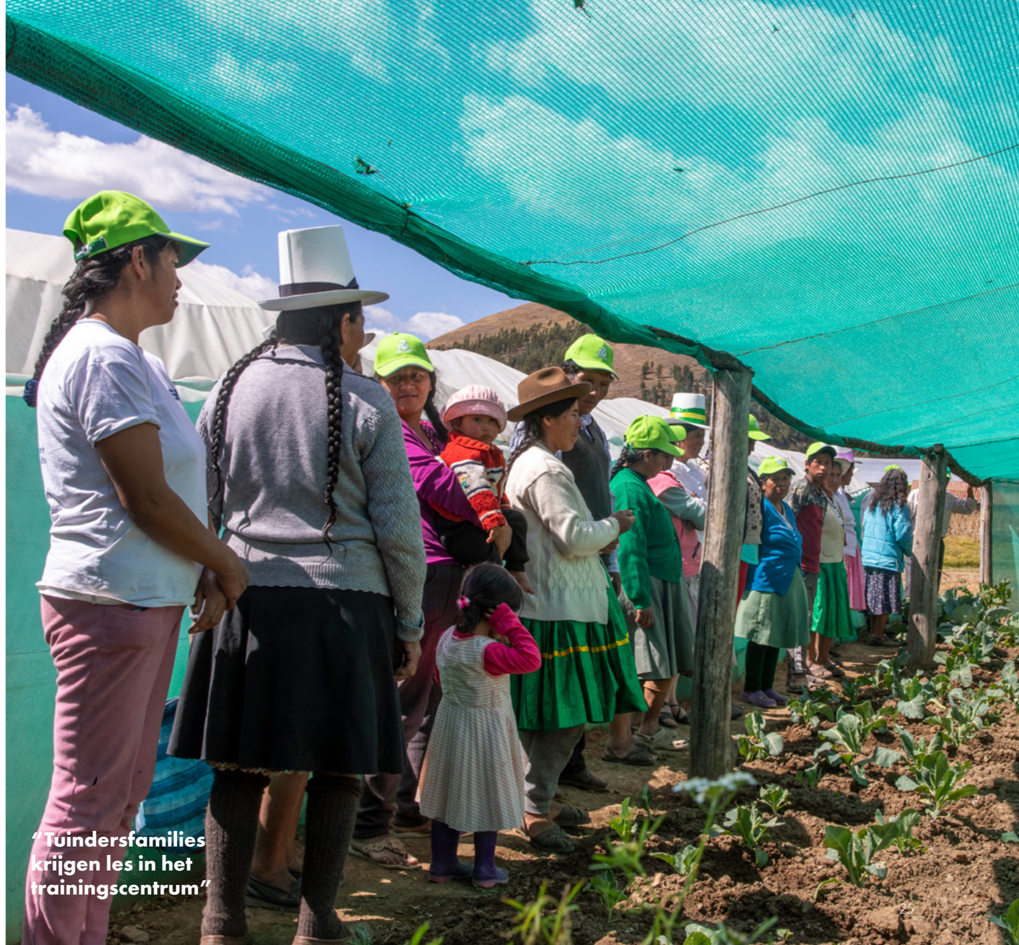
"Tuindersfamilies krijgen les in het trainingscentrum"

Aprodés geeft training over verschillende (nieuwe) teeltmethoden en deelt praktische teeltkennis met de lokale bevolking. Het Aprodés-team zet zich in voor de meest kwetsbare families in Peru. Steeds meer families hebben door Aprodés een eigen moestuin. Een deel van de groente gebruiken ze voor eigen consumptie. Een ander deel geven ze weg aan familie en vrienden of verkopen ze op de markt. Aprodés heeft in totaal ruim 1300 families bereikt.