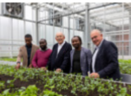
Stichting Jarikin op bezoek bij Rijk Zwaan.

H aïti heeft te maken gehad met verschillende natuurrampen. Een aardbeving in 2010 en verschillende orkanen hebben veel schade toegebracht. Mede hierdoor is Haïti een van de armste landen ter wereld. De stichting Jarikin is al enkele jaren actief in Haïti en biedt algemeen basis- en voortgezet onderwijs én start ook met het geven van tuinbouwonderwijs.