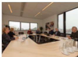
De COS bij elkaar.

“De steun aan ontwikkelingsprojecten vanuit de COS is stevig verankerd in ons bedrijf.”