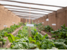
De kas van Adobe-materiaal.

D oor Kusimayo worden er stappen gezet in het Peruaanse Altiplano-gebied. Het leven van de lokale bevolking, families en kinderen gaat stapje voor stapje vooruit. Ze zijn gezonder, mede door de betere voeding. De kwaliteit van leven is aanzienlijk verbeterd.