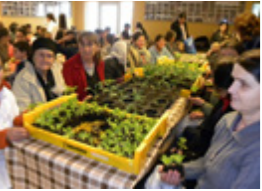
Moeders die opgekweekte plantjes mee naar huis krijgen

H oewel er vooruitgang wordt geboekt, is er nog steeds veel armoede in Albanië. De stichting Hoop voor Albanië zet zich daarom in voor het land en biedt hulp aan vele projecten door het gehele land waar onder het project Seed of Hope in de hoofdstad Tirana.