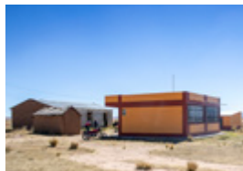
Het nieuwe schooltje

“Kinderen uit de hoogvlakte voor het oude schooltje”