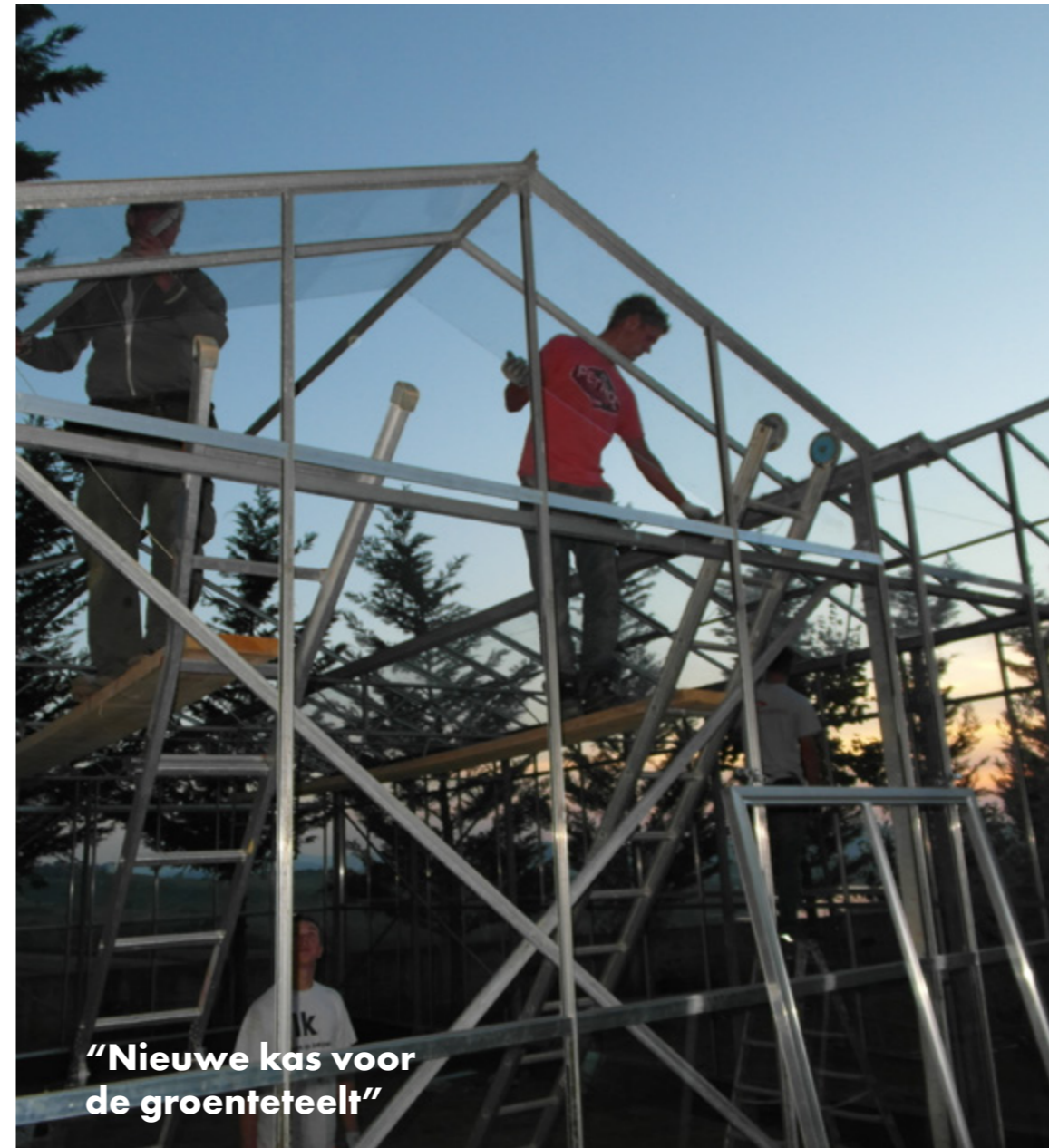
"Nieuwe kas voor de groenteteelt"

Eind november 2019 werd Albanië getroffen door een krachtige aardbeving met een grote reeks heftige naschokken. Ook in de gebieden waar Hoop voor Albanië actief is, is de nood hoog. Veel gezinnen zijn getroffen en dakloos geraakt. Hun huis, veelal hun enige bezit, zijn ze kwijtgeraakt.