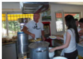
Gratis warme maaltijd voor de kinderen