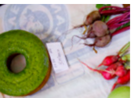
Schoolkinderen eten heerlijke groentecake gebakken door hun moeders

O p ruim 3800 meter boven zeeniveau, in het Altiplano-gebied in Peru, worden kinderen en hun families geholpen door Kusimayo. De stichting doet dit op verschillende manieren. De lokale bevolking is blij met de hulp.