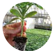
Alany fajták dinnye oltásra