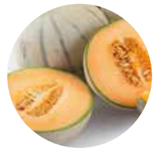
Sárgadinnye Olasz Kantalup, és Galia fajták