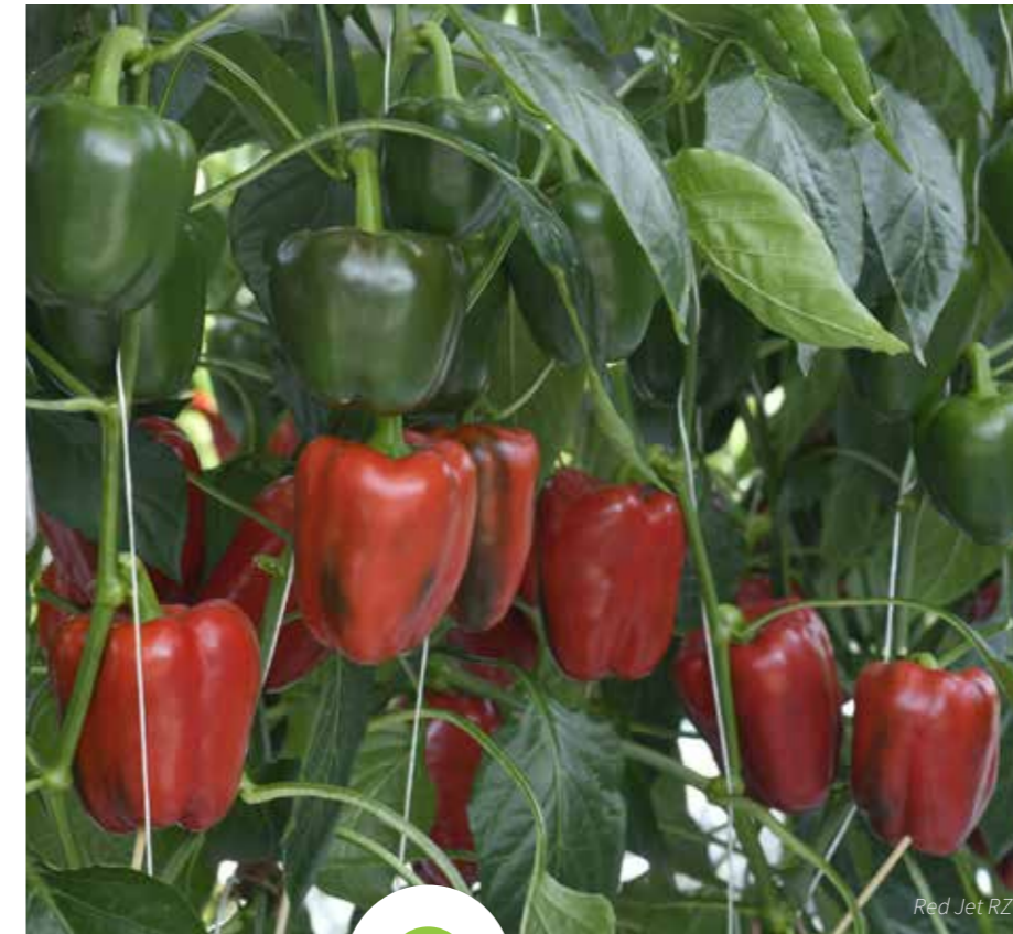
Red Jet RZ