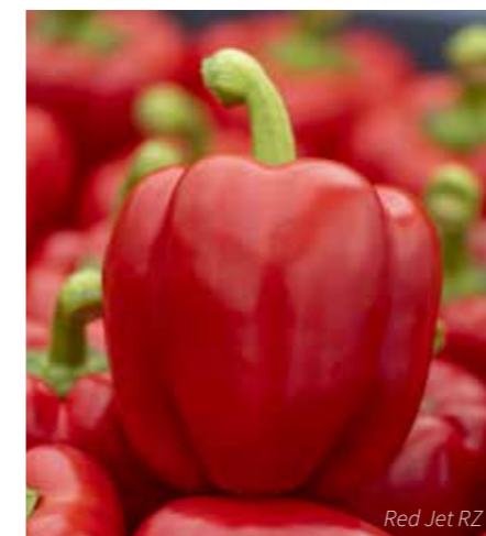
Red Jet RZ