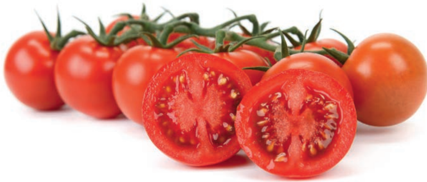
Bellioso RZ - Internal Red