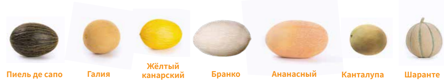
Пиель де сапо