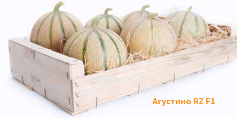
Агустино RZ F1

* Гибрид находится в стадии регистрации на территории РФ