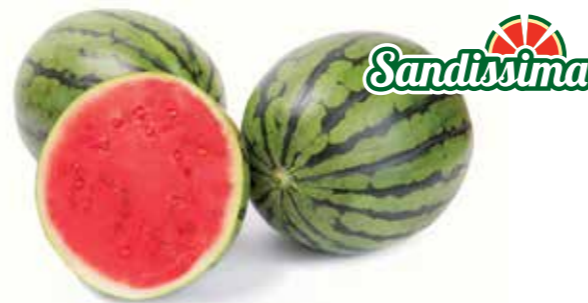
Тигриньо RZ F1