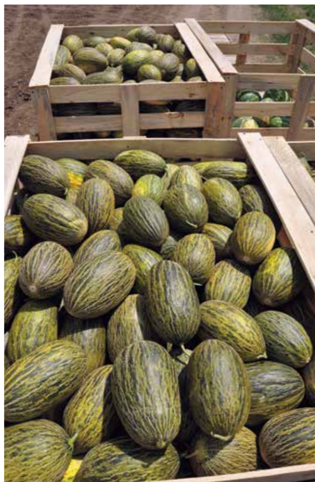
Фото 11. Доставка дыни в деревянных контейнерах с поля на склад

в закрытом пространстве позволяет обеспечить равномерность температуры и относительной влажности. Рекомендуемая кратность циркуляции – 100-150 м 3 воздуха на тонну продукции в час. В период основного хранения (зимой) циркуляцию снижают на 50%. Периодическую циркуляцию осуществляют при отклонении температуры и относительной влажности воздуха от установленных значений. С некачественным воздухообменом в хранилищах связана возможная конденсация влаги на плодах дыни, которая может вызывать заболевание овощей и их гниение. Во время хранения нужно следить, чтобы в хранилище не было застойного воздуха, в котором скапливается углекислота и этилен, выделяемые при дыхании дыни, что также ухудшает условия хранения. Поэтому хранилище целесообразно оборудовать системой вентиляции и регулировать её работу. Идеальная температура хранения дыни типа Пиель де Сапо: +14°C и относительная влажность воздуха 70-80%.