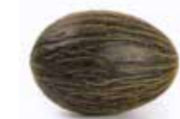
Пиель де Сапо