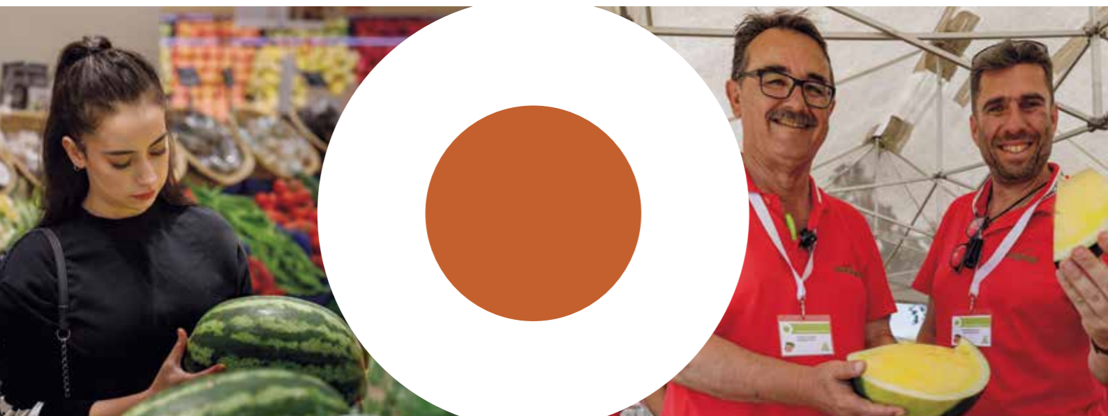
62-599 RZ F1