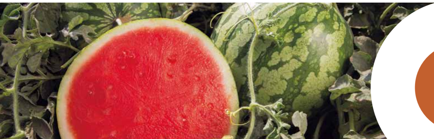
Кидман RZ F1