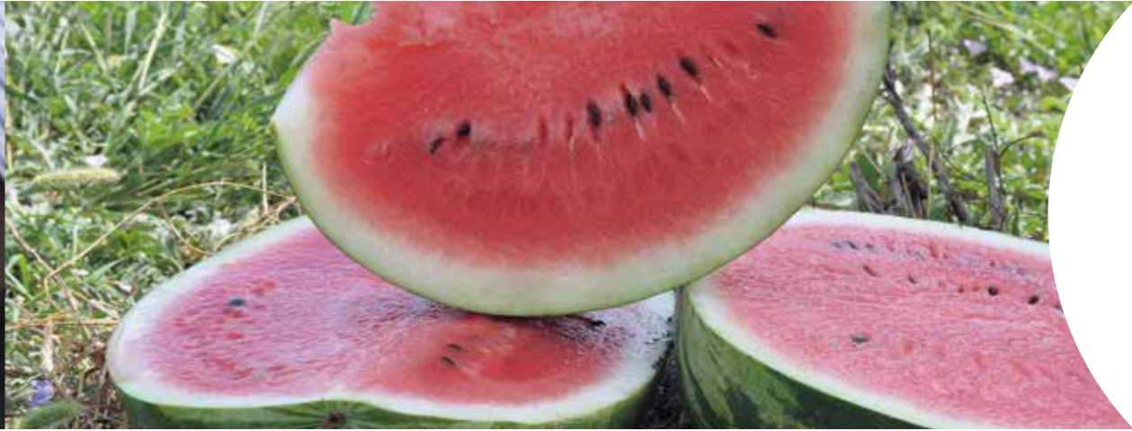
Коламбия RZ F1