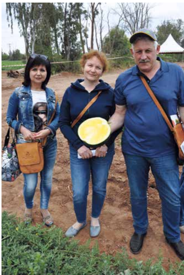
Фото 14. Жёлтый бессемянный арбуз 62-599 RZ F1

Рекомендуется в качестве опылителя использовать порционный гибрид арбуза с виноградной косточкой Тигринья RZ F1 (см. фото 13 ) на бессемянных арбузах с темным цветом кожуры Титания RZ F1 и 62-599 RZ F1 (см. фото 14 ), и гибрид порционного арбуза Конгуйта RZ F1 — на бессемянных арбузах с тигровым цветом кожуры Кидман RZ F1 и стандартным цветом кожуры кримсон свит Ланикай RZ F1.