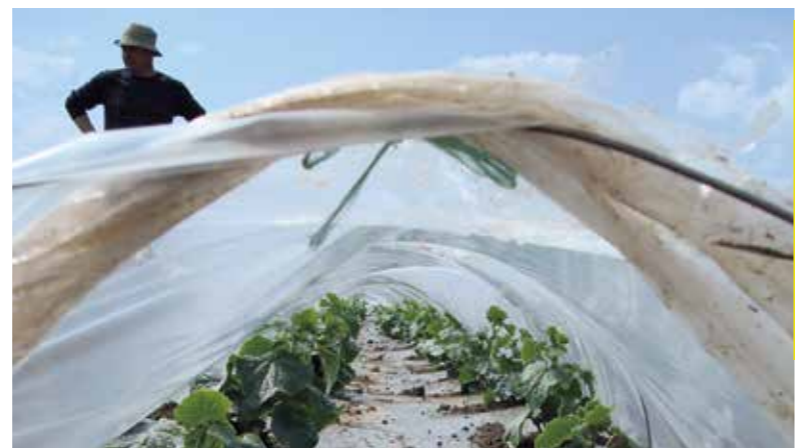
Фото 3. Вид тоннеля изнутри

При выращивании рассады дыни для условий открытого грунта используют кассеты из поливинилхлорида на 44, 50, 96 ячеек. Также отдельные фермеры применяют рассадные кассеты из картона и прессованного торфа. На данном этапе выращивания рекомендуется применять