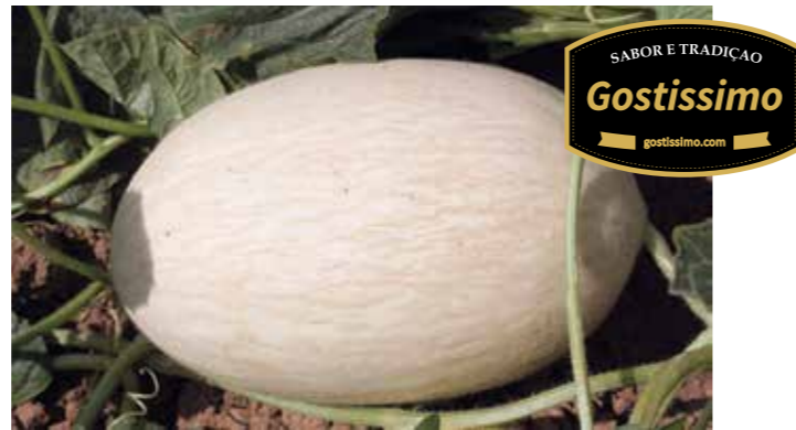
Портоальто RZ F1