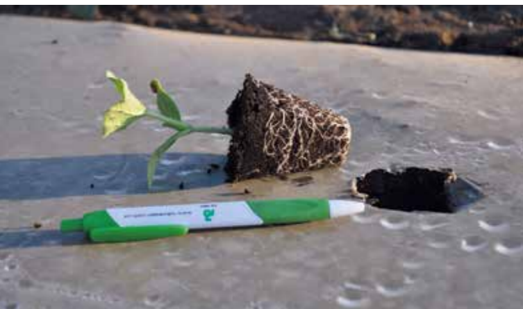
Фото 1. Рассада дыни готова к высадке в открытый грунт

Для получения раннего урожая дыни необходимо использовать плёночные укрытия (метод «термоса»). Двойная плёнка используется для очень раннего урожая, однослойные пленочные туннели — для раннего урожая (см. фото 1 и 2 ), без укрывной плёнки — основной сезон выращивания. При интенсивной технологии выращивания дыни рекомендуется использовать мульчирующую плёнку в прикорневой зоне (толщина плёнки 0,7-1,1 мм). Это позволяет улучшить водно-воздушный баланс корнеобразующей зоны растения.