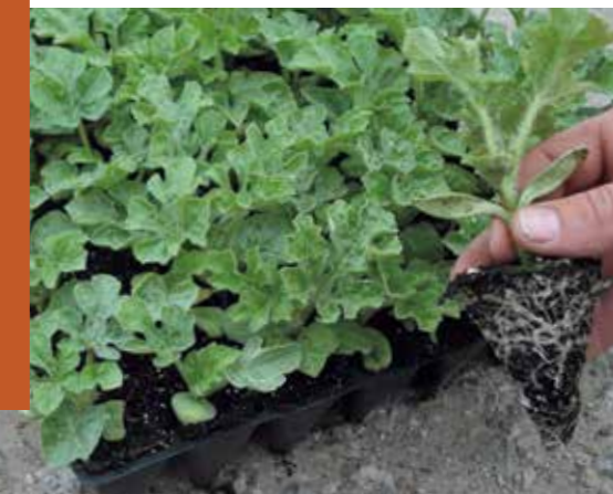
Фото 12. Готовая к высадке рассада бессемянного арбуза

В ассортименте компании “Райк Цваан” есть арбузы разных типов, но все большую популярность набирают бессемянные арбузы с высокими вкусовыми качествами и удобные для конечного покупателя. Бессемянные арбузы получены при помощи скрещивания обыкновенных диплоидных гибридов с гибридами, хромосомный набор которых был переведен в тетраплоидное состояние (увеличен в 2 и более раза). В связи с этим у растений, выращенных из триплоидных семян формируется нежизнеспособная пыльца (стерильная). Технология получения бессемянных арбузов описана ниже.