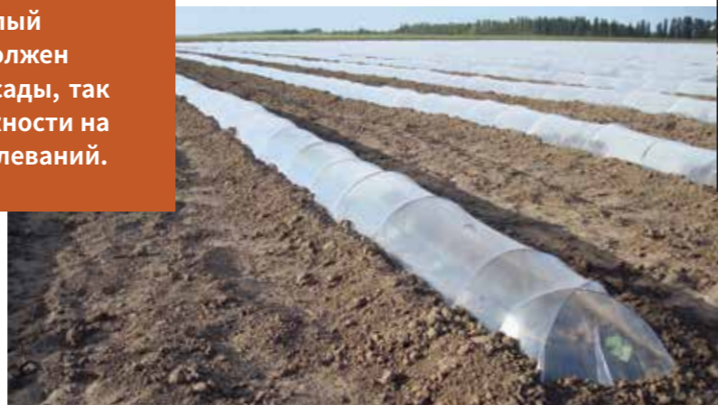
Фото 2. Тоннели для получения раннего урожая

Перед высадкой рассада дыни должна иметь 2-3 настоящих листа и мощную корневую систему (обычно это происходит через 25-30 дней) — см. фото 3 . Для получения ультраранних урожаев дыни при выращивании рассады используют торфоперегнойные кубики или стаканы емкостью 0,4-0,5 л. В таком случае возраст рассады перед высадкой будет составлять 45-50 дней, и растение может иметь до 5-6 листьев.