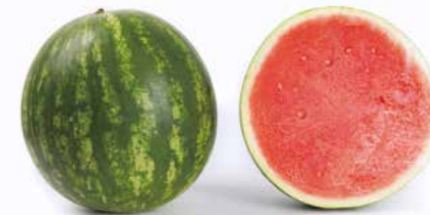
Ланикай RZ F1