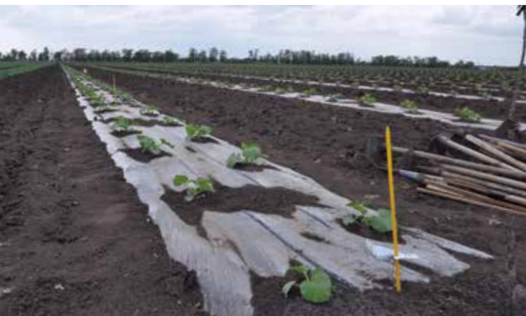
Фото 5. Капельная лента размещена под каждым рядом дыни, а мульчирующая пленка позволяет оптимизировать водно-воздушный баланс корнеобразующей зоны

выращивания расстояние между центрами рядов – 1,6-2,0 м, между растениями в ряду – 0,5-1,0 м. Данная схема позволяет создать оптимальный воздухообмен, ограничить скопление лишней влаги и предотвратить возможные заболевания листового аппарата. Перед высадкой рассады необходимо понимать, какой тип дыни выращивается и какие характеристики выращиваемого гибрида, чтобы подобрать оптимальную схему высадки.