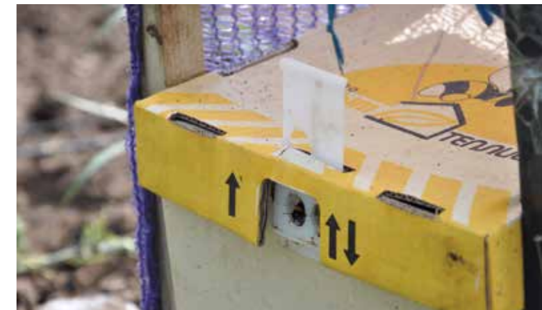
Фото 15. Ульи на арбузных полях

В среднем необходимое количество удобрений на 1 га в действующем веществе должно быть на уровне: