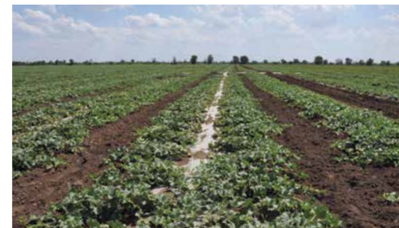
Фото 6. Расправление плетей и междурядная культивация – важные агротехнические приемы при выращивании дыни

Расправление плетей на дыне – часто используемый агроприём, способствует лучшему воздухообмену (меньшему застаиванию влаги), особенно при двухстрочной системе выращивания (когда на одной гряде растет два ряда дыни). Важно аккуратно направлять ботву перпендикулярно, в сторону междурядий, стараясь не менять направление размещения листьев на плетях. Грубое расправление плетей является причиной появления листовых заболеваний или сгорания перевернутых листьев под воздействием солнца (см. фото 6 ).