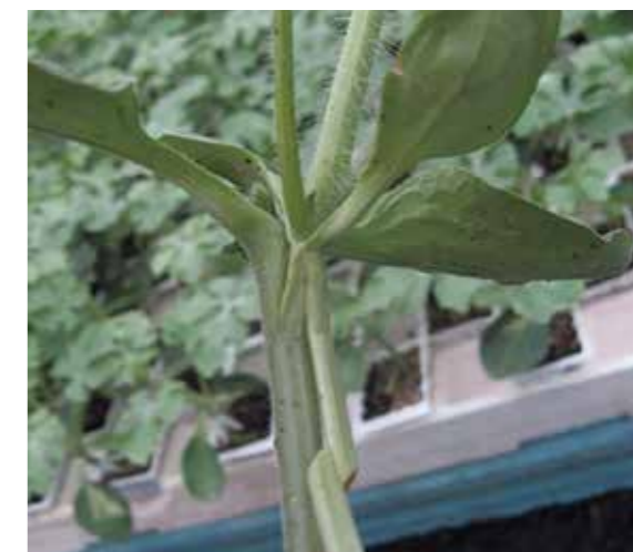
Фото 18. На 30-35-й день после прививки