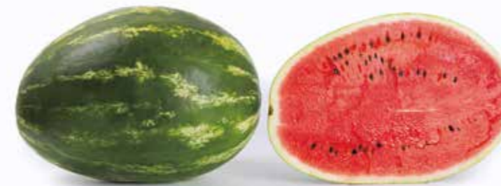
Морган RZ F1