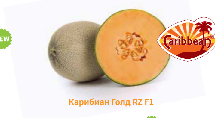
Карибиан Голд RZ F1