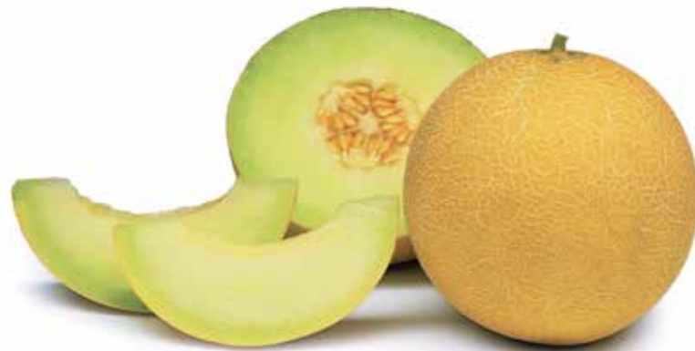
Юкар RZ F1