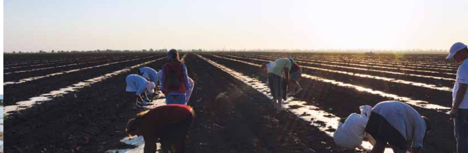
Фото 4. Внесение гранулированных инсектицидов в лунки перед высадкой рассады

Лучшими предшественниками для дыни могут быть следующие овощные культуры: лук, капуста, морковь, свёкла, картофель.