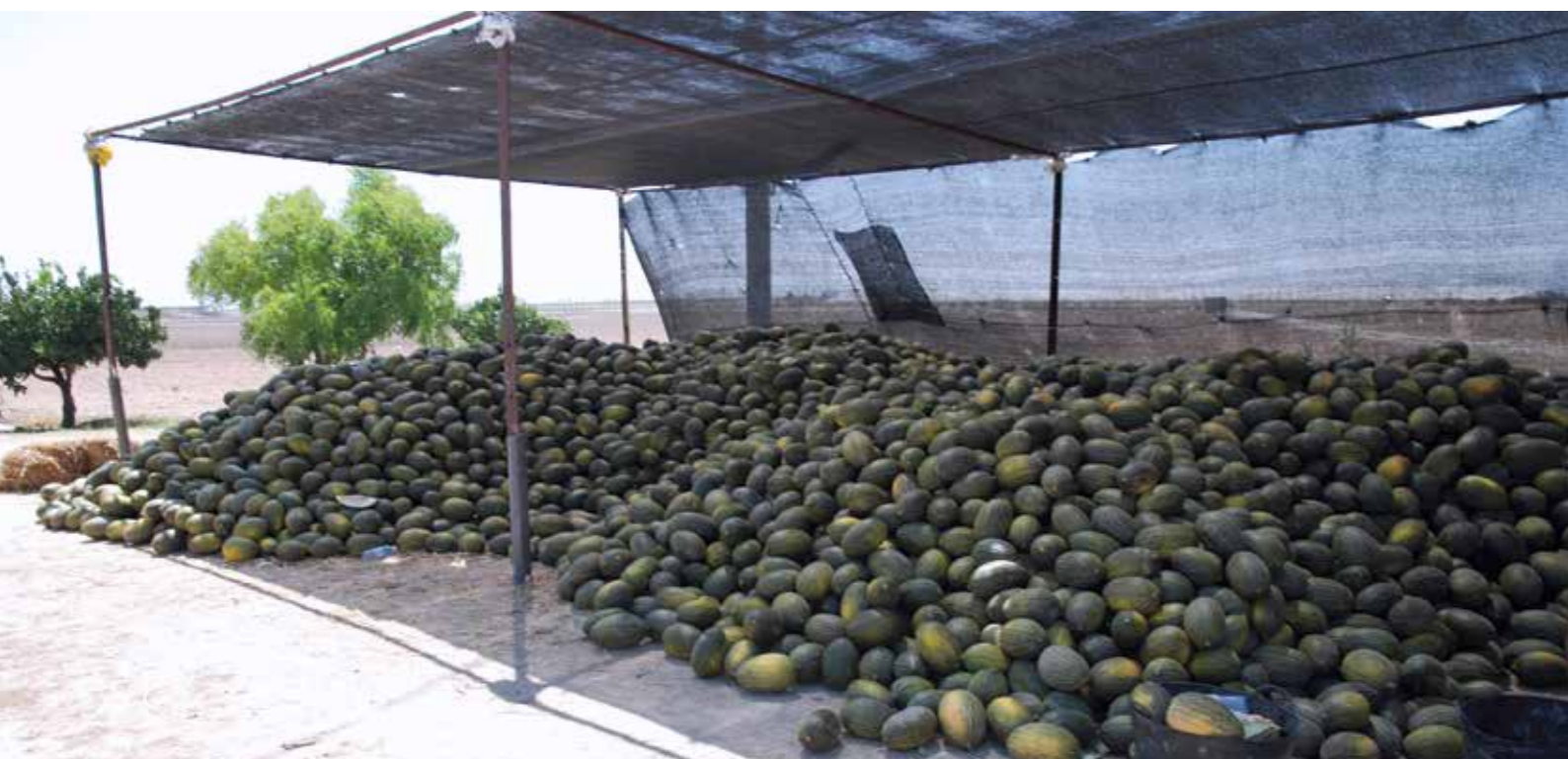
Фото 10. Охлаждение дыни под навесом из зелёной сетки