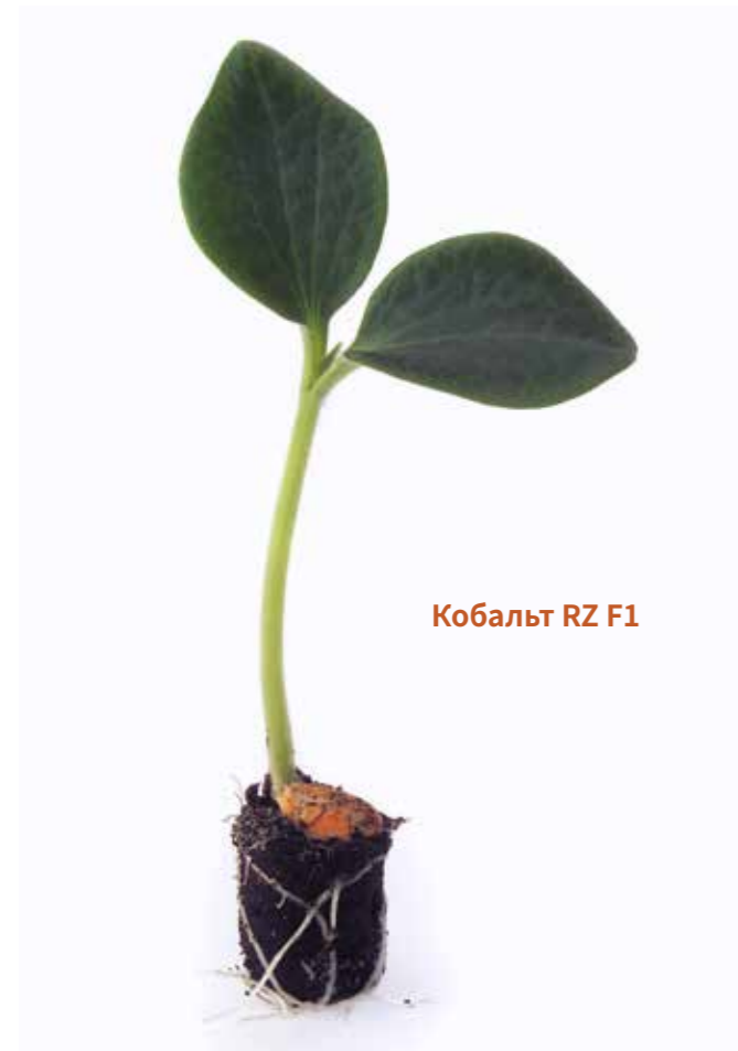
Кобальт RZ F1