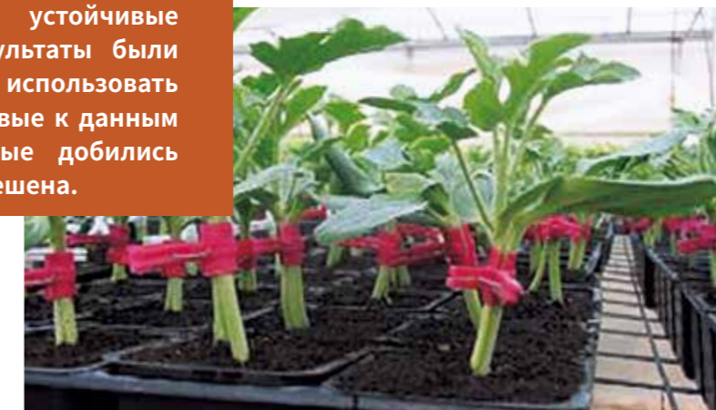
Фото 16. Привитая рассада арбуза

f. sp. niveum (Fon), из-за которого фермеры полностью теряют урожай на арбузных полях. Некоторые гибриды имеют повышенную устойчивость к расам 0 и 1 фузариоза, но большинство восприимчивы к расе 2, которая распространена практически во всех арбузных регионах планеты.