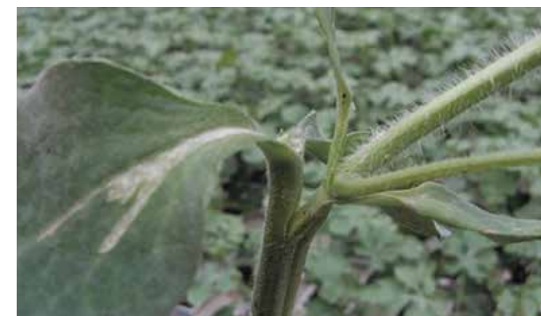
Фото 17. На 20-21-й день после прививки

Дальнейшая технология выращивания ничем не отличается от общепринятой технологии выращивания арбузов рассадным способом (полив, подкормки и т.д.).