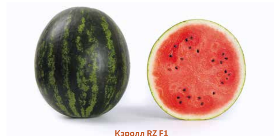
Кэрролл RZ F1