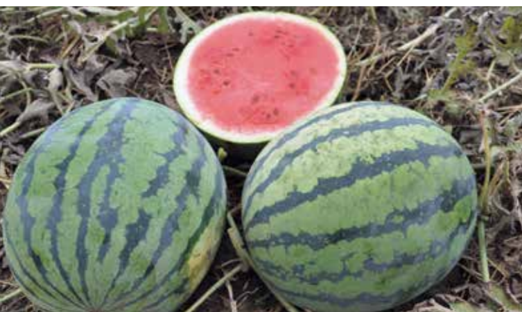
Фото 13. Гибрид Тигринья RZ F1 – идеальный опылитель для бессемянных арбузов с черным окрасом кожуры

Как в первом, так и во втором варианте мы должны несколько раз проводить высадку на одном и том же поле (сначала – бессемянный арбуз, потом – опылитель), что немного усложняет технологию выращивания и требует определенных трудовых ресурсов, способных оперативно провести высадку