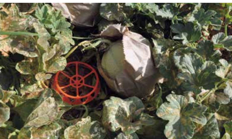
Фото 9. Подложка под плод, бумажный чехол от солнца

плодов. Для более длительной сохранности рекомендуется срезать плоды секатором с небольшой (1-1,5 см) плодоножкой. Не рекомендуется использовать для транспортировки банановые ящики, бывшие в употреблении, так как они могут служить потенциальным источником заражения плодов различными заболеваниями (белая, серая, розовая гниль, фитофтора, фузариум, бактериозы – Erwinia, Pseudomonas).