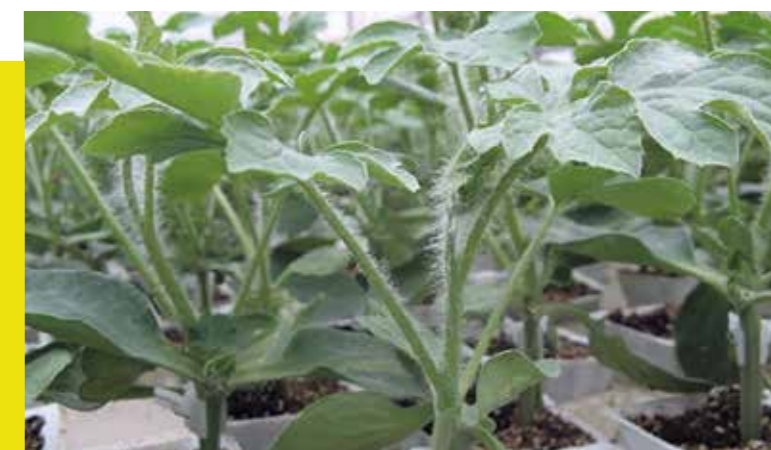
Фото 19. На 40-45-й день после прививки

ПРИМЕЧАНИЕ: Информация по выращиванию дыни и арбуза базируется на многолетнем практическом опыте выращивания в основных регионах культивирования данных культур на протяжении многих лет. Все указанные в рекомендациях препараты (средства защиты растений, удобрения) взяты как пример (за основу) и могут быть заменены равнозначными по формуле или по действующему веществу препаратами.