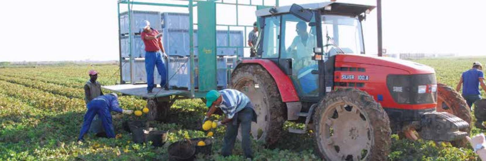
Фото 7. Уборка дыни жёлтого канарского типа Дукрал RZ F1