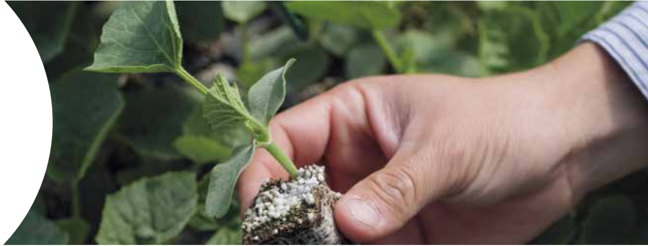
Сфинкс RZ F1