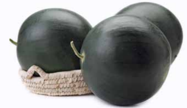
Уэльва RZ F1