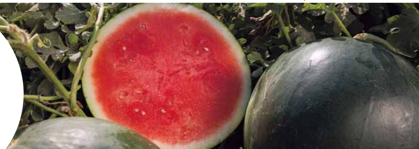
Титания RZ F1