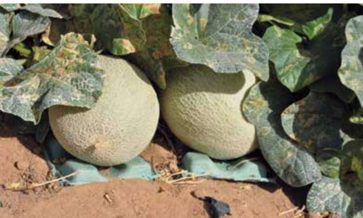
Фото 8. Подложка под плод

Уборка плодов дыни ананасного типа и типа Галия начинается с момента начала приобретения кожурой соответственного, желтоватого оттенка цвета с присутствующей легкой прозеленью (в случае транспортировки на дальние расстояния рекомендуется убирать плоды за 3-4 дня до планируемого созревания, когда цвет кожуры светло-серый или серовато-жёлтый). Плоды укладываются в гофрокартонную тару по 3-6 штук в зависимости от размера