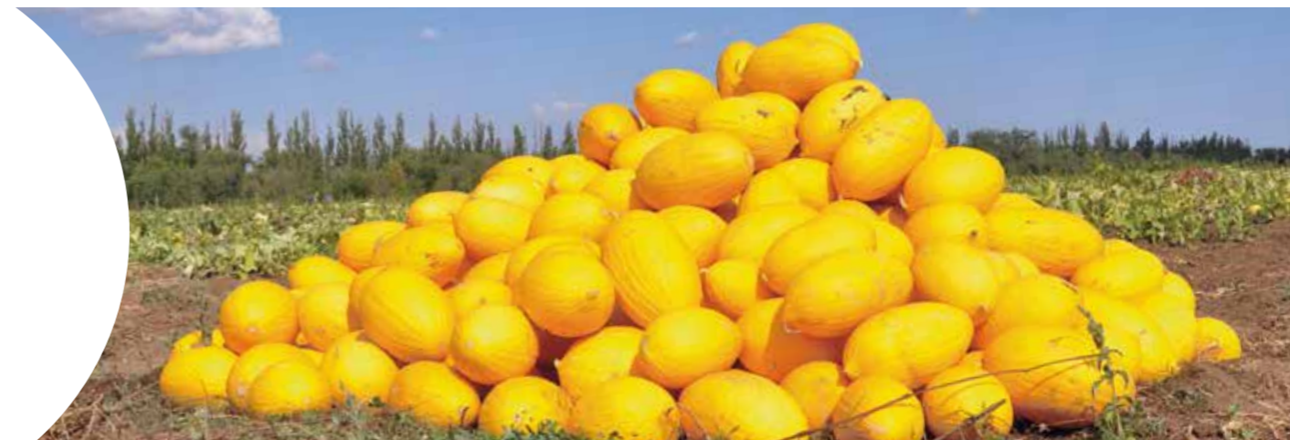
Дукрал RZ F1