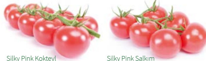
Silky Pink Kokteyl

Üretim: Silky Pink® kokteyl ve Silky Pink® salkım segmentindeki lider ticari çeşitlerden oldukça iyi bir şekilde ayrılmaktadır. Silky Pink® kokteyl segment: Silky Pink® kokteyl güçlü bitkisi sayesinde oldukça güzel ve düzgün bir salkım yapısı oluştururken, yüksek ve erkenci bir verimlilik de sağlar. Silky Pink® salkım ise kuvvetli, jeneratif ve daha uzun bitki yapısı ile muhteşem meyve tutumu sağlar.