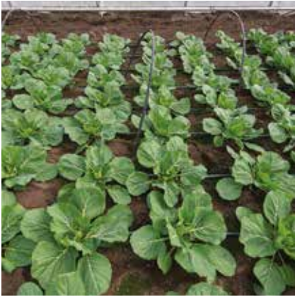
Zarissima RZ - speedy/40x50 cm