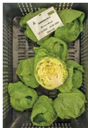
Zarissima RZ speedy/40x40 cm