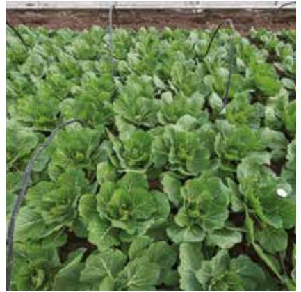
Zarissima RZ - 5x5 cm kocka/40x40 cm