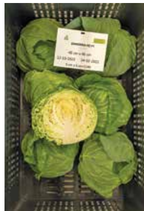
Zarissima RZ 5x5 cm kocka/40x40 cm