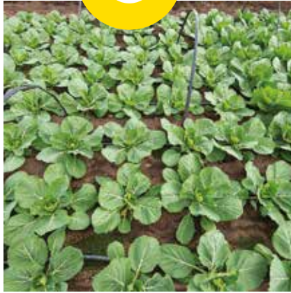
Zarissima RZ - speedy/40x40 cm