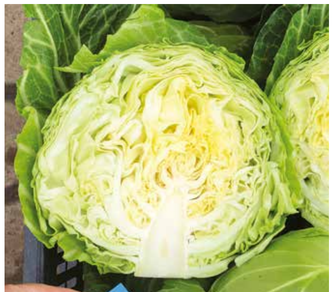
Pushma RZ - 5x5 cm kocka/40x40 cm