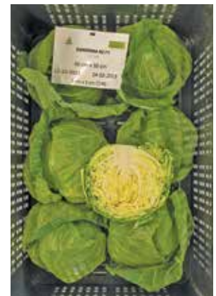
Zarissima RZ 5x5 cm kocka/40x50 cm