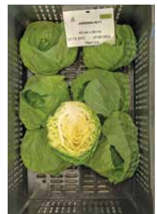
Zarissima RZ speedy/40x50 cm