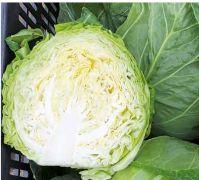
Zarissima RZ - 5x5 cm kocka/40x40 cm

Az első ültetésben a kereskedelmi fajták közül a Zarissima RZ adta a legnagyobb termést: 6,16 kg-ot négyzetméterenként, 40 x 40 cm-es térállásnál, 5 cm-es kockában ültetve és 62 nappal a kiültetés után lemérve. A 69. napon már a Pushma RZ vezetett, ugyanebben a térállásban és kockaméretben 8,83 kg-ot produkált négyzetméterenként. A Zarissima RZ nem sokkal maradt le, 8,49 kg/m 2 hozamot mutatott. A második ültetésben szintén a Zarissima RZ nyert, igaz, nem sokkal, 20 g-mal! A 40 x 40 cm-es térállásban, 5 cm-es kockával ültetve 8,19 kg-ot termelt négyzetméterenként, szemben a Pushma RZ 8,17 kg-os értékével. A teszt legnagyobb fejsúlyát az első ültetésben mértük, 69 nappal kiültetés után. A 40 x 50 cm -re 5-ös kockában ültetett Pushma RZ 1,71 kg átlagsúlyú fejeket hozott, ugyanez tálcsa palántával 1,41 kg! A sorban második a Zarissima RZ, ugyanilyen feltételek mellett, 1,59 kg-os súllyal.