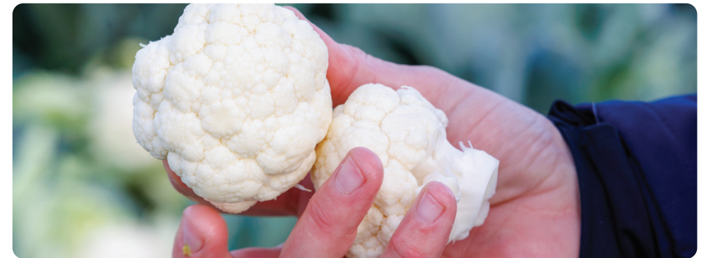
Gemiddelde opbrengst en groei duur Industriebloemkool herfst België 2020-2024 Bron: Viaverda

De kool van Flortres heeft de ideale opbouw. Doordat er meer roosjes op de kool zitten, blijven deze langer binnen de optimale afmetingen. De roosjes zijn uitermate hard en groeien niet in elkaar, waardoor er nauwelijks kruim ontstaat tijdens oogst en verwerking. De uitstekende zelfdekbaarheid zorgt dat de kool zowel van binnen als van buiten mooi wit blijft, zelfs tot laat in het seizoen.