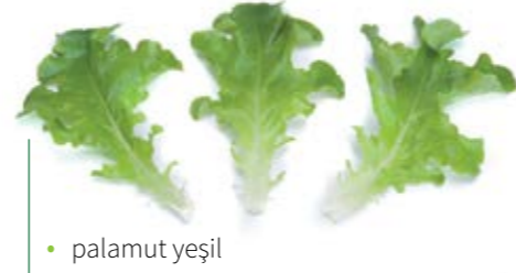
• palamut yeşil