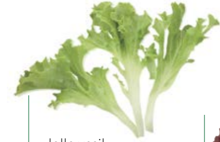
• lollo yeşil