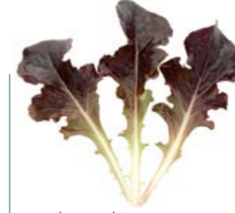
• palamut kırmızı