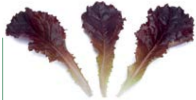
• kivircik kırmızı