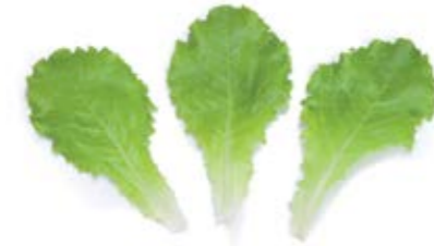
• kivircik yeşil