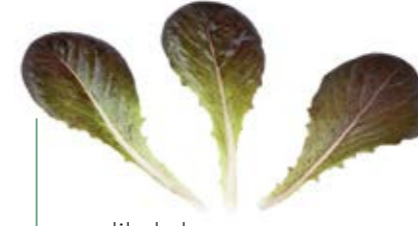
• yedikule kırmızı