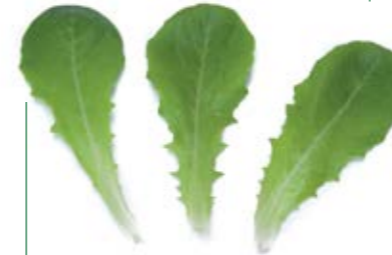
• yedikule yeşil