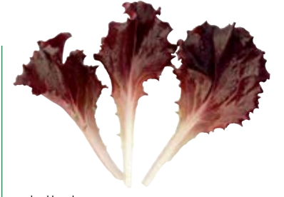
• lollo kırmızı